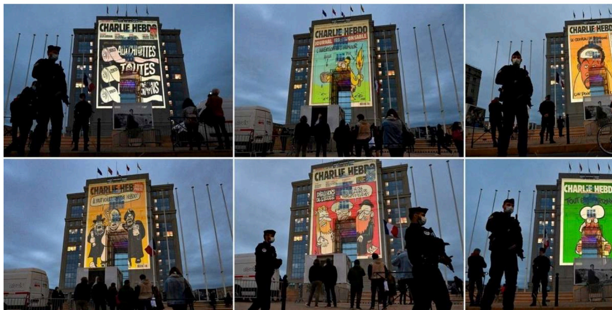
Des caricatures de Charlie Hebdo projetées sur des immeubles à Toulouse et à Montpellier Karikaturen von Charlie Hebdo auf Gebäude in Toulouse und Montpellier projiziert