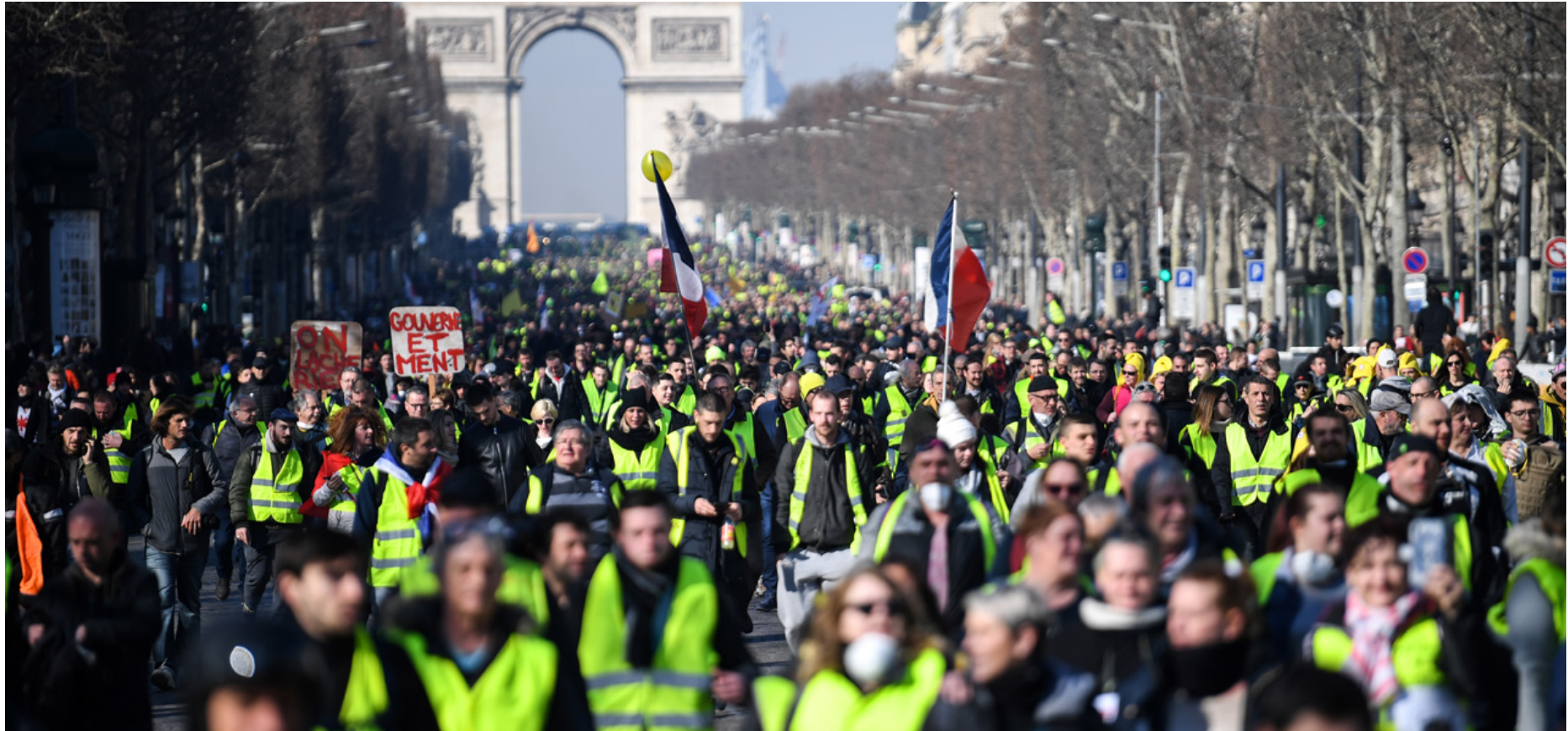
Manifestation de gilets jaunes sur les Champs Élysées, en février 2019 (acte 14) Gelben Westen demonstrieren auf der Champs Élysées in Februar 2019 (14. Akt)